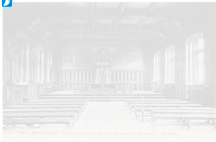
270 - BRUXELLES. Intérieur de l'Hôtel de Ville, la Salle des Mariages.